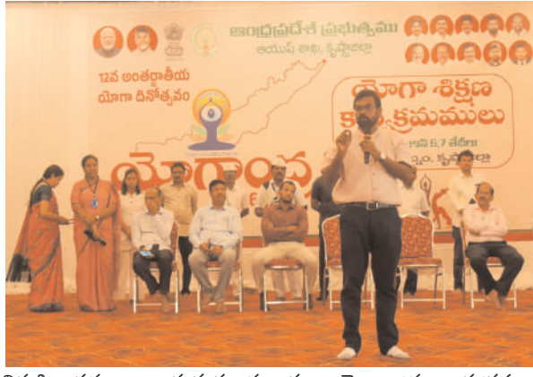
నిర్వహించడం జరుగుతుందన్నారు. యోగాంధ్ర కార్యక్రమం

మచిలీపట్నం జూన్ 6 : (వార్తా ప్రభ ప్రతినిధి): ఆరోగ్యకర సమాజం నిర్మించడానికి ప్రతి ఒక్కరూ ముందుకు రావాలని జిల్లా కలెక్టర్ డీకే బాలాజీ ఒక ప్రకటనలో ప్రజలకు పిలుపునిచ్చారు. ఆరోగ్యమే మహాభాగ్యం అని ఆరోగ్యంగా ఉంటే అంతకు మించిన సందలేదని మన చేతుల్లో మన ఆరోగ్యం ఉందని కలెక్టర్ పేర్కొన్నారు. ప్రాణం ఉన్నంతవరకు ప్రాణాయామాలు చేద్దామని, అవయవాలు ఉన్నంతవరకు ఆసనాలు వేద్దామని కలెక్టర్ పిలుపునిచ్చారు. రాష్ట్ర ప్రభుత్వం ఆదేశాల మేరకు ఈనెల 7 వ తేదీ నుండి 21వ తేదీ వరకు జిల్లా వ్యాప్తంగా పలు యోగాంధ్ర కార్యక్రమాలు నిర్వహిస్తున్నట్లు కలెక్టర్ వివరించారు. ఈనెల 7 వ తేదీ ఆదివారం ఉదయం 7 గంటలకు మంగిలపూడి బీచ్ లో యోగాంధ్ర కార్యక్రమాలు